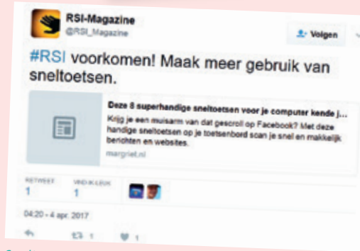
Sneltoetsen voor Facebook van weekblad Margriet.