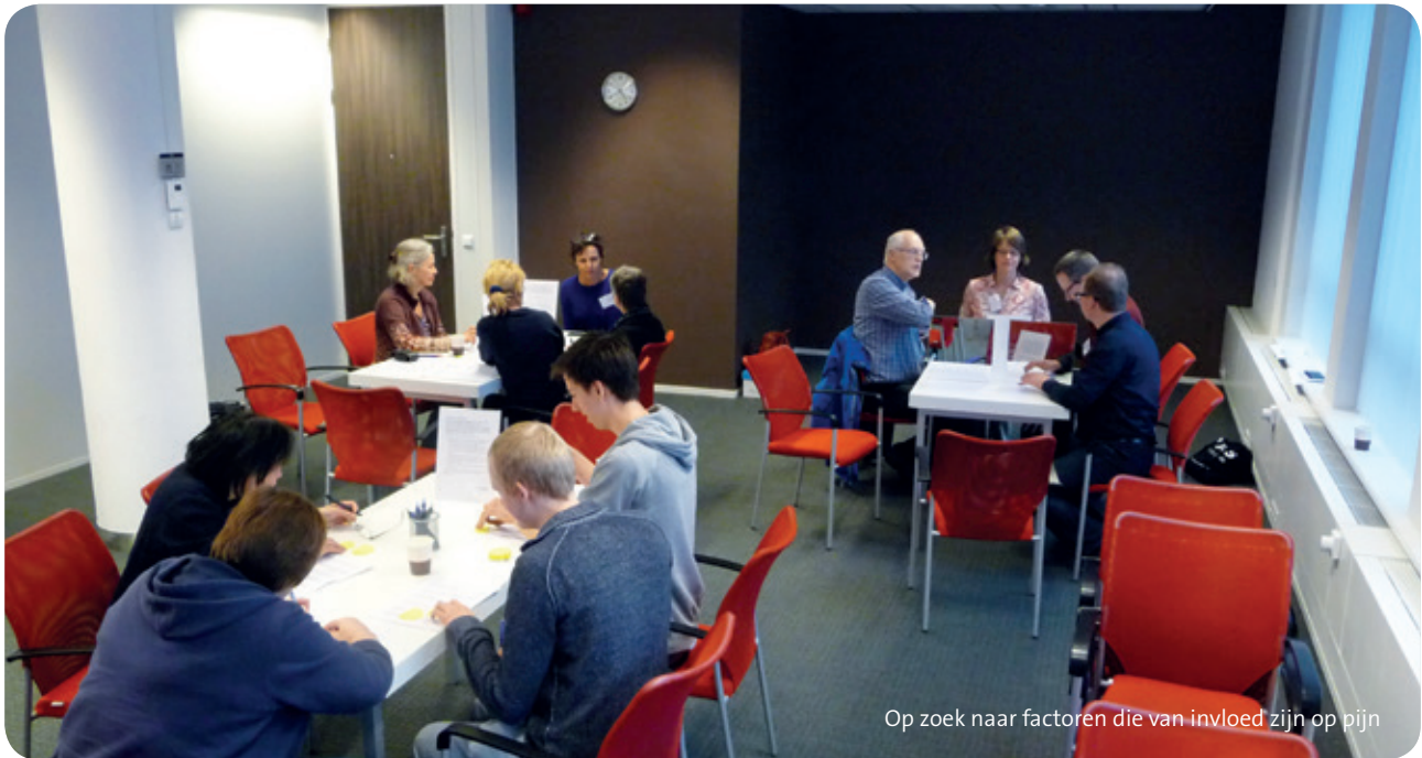
Op zoek naar factoren die van invloed zijn op pijn

regelmatig naar congressen, omdat veel huisartsen, fysiotherapeuten en andere eerstelijns-behandelaars nog niet op de hoogte zijn van de revalidatiemogelijkheden. Ook werkt ze nu zelf bij Heliomare en heeft ze, als pijncoach, haar eigen praktijk in Haarlem.