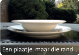
Een plaatje, maar die rand ...