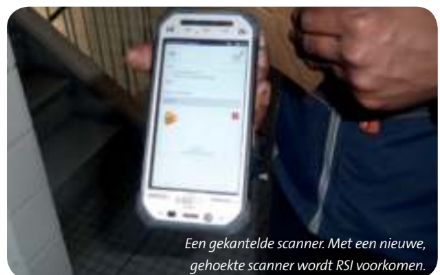
Een gekantelde scanner. Met een nieuwe, gehoekte scanner wordt RSI voorkomen.