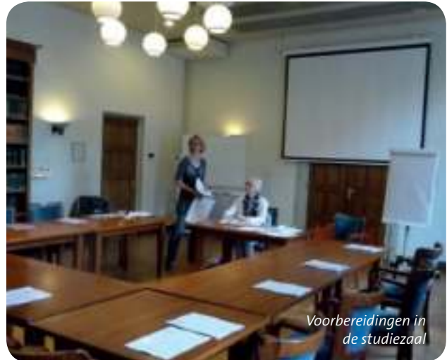
Vorbereidingen in de studiezaal