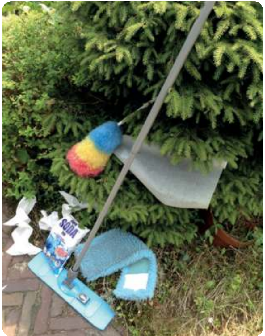
Met wat handige tips, hoef je met RSI je schoonmaakspullen niet in de ... euh ... dennen te hangen

Gebruik zo min mogelijk de stofzuiger, dat is zwaar werk. Helaas heb je die bij het reinigen van tapijt wel nodig. Neem bij deze inspanning na elke tien minuten even pauze. Een alternatief voor de stofzuiger is een rolveger. Met name die modellen die, naast een grote roller, aan weerszijden nog een kleine roller hebben. Daarmee maak je gemakkelijk plinten schoon. De rolveger bevat een knop waarmee je de kracht van het vegen lichter of zwaarder kunt maken. Een ander alternatief voor een stofzuiger is de kruimeldief met een lange steel; handig voor op de trap en lichter dan een stofzuiger. Of de ministofzuiger die je op de bank zet; met een flexibele steel kun je de zitting gemakkelijk reinigen. Linoleum, vinyl, laminaat en tegelvloer kun je met weinig spierkracht schoonmaken door een vloerwisser met een vochtig dweiltje of stofhoes te gebruiken. Een vloerwisser met uitwringemmer lost vervolgens het probleem van het uitwringen voor je op.